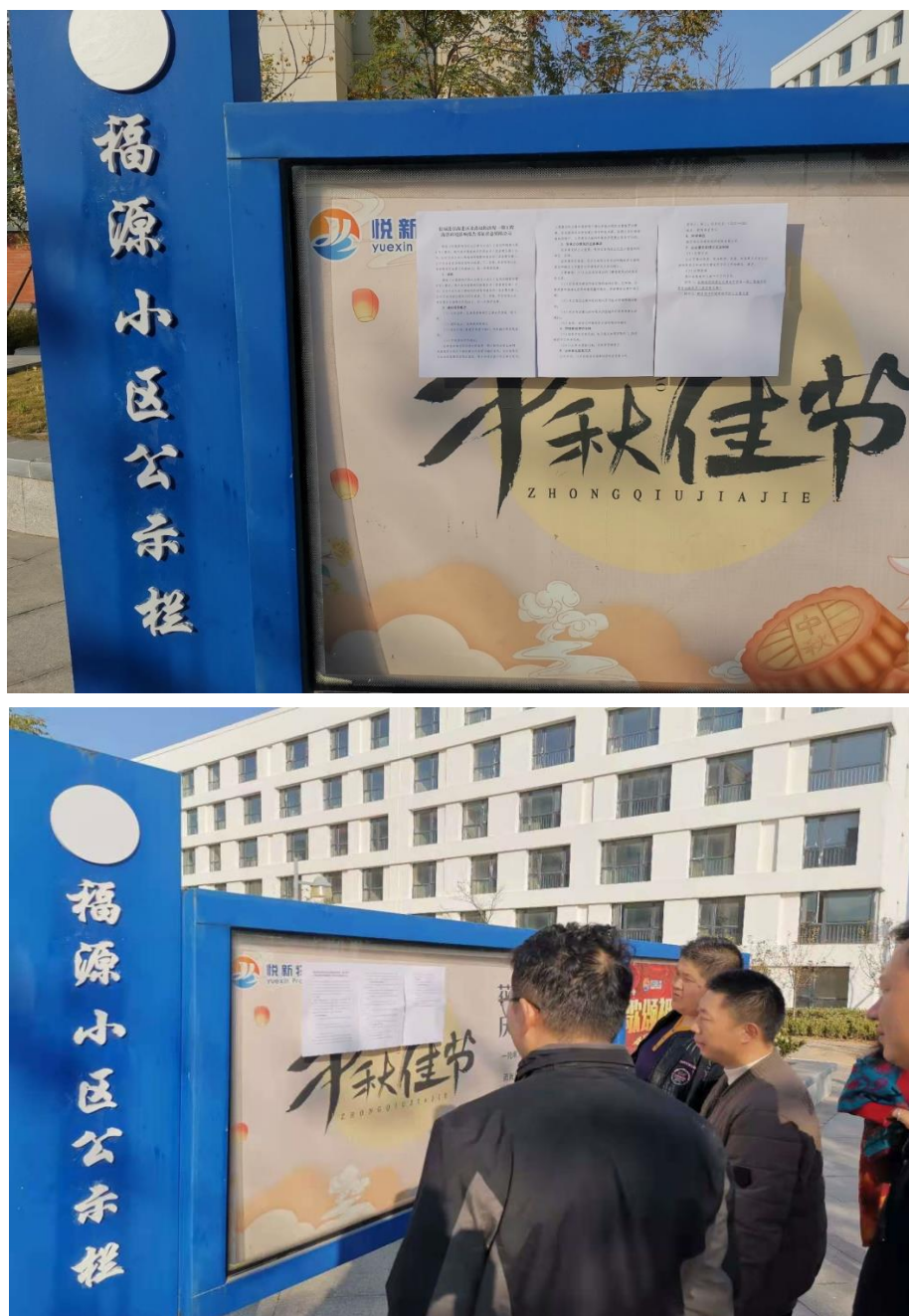
图 3.2-2 征求意见稿公示现场张贴

本次现场张贴的地点包括工程附近小区公示栏，是公众易于知悉的场所。符合《环境影响评价公众参与办法》中关于现场张贴的要求。