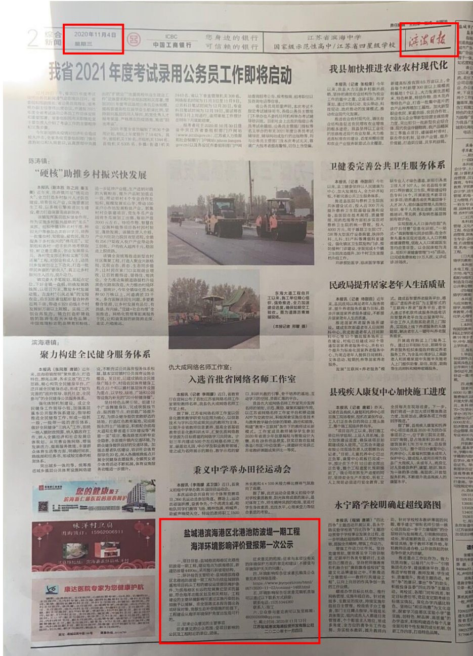
图 3.2-3 滨海日报第一次公示（2020 年 11 月 4 日）

滨海日报在盐城市滨海县发行量较大，是所在地公众易于接触的报纸。符合《环境影响评价公众参与办法》中关于报纸公示的要求。